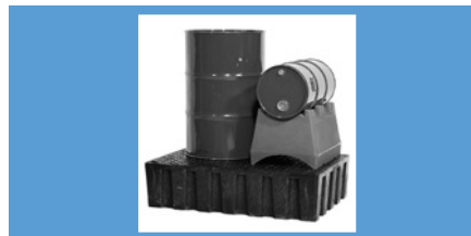
Vol.* 2 bidones Pag. 176