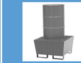
Vol.* 1 bidón Pag. 175