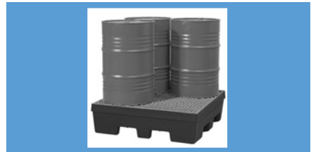
Vol.* 4 bidones Pag. 178