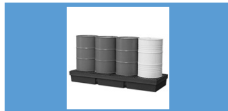
Vol.* 4 bidones P. 178