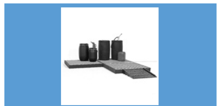
Cap. 220 y 400 lts. Pag. 183