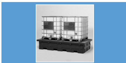
1 KTC Pag. 182