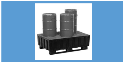
Vol.* 2 bidones Pag. 176-177