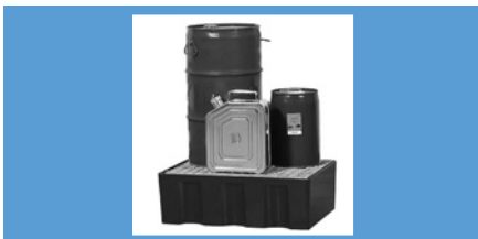
Vol.** 2 bidones Pag. 179