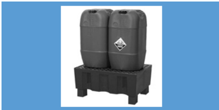
Vol.** 2 bidones Pag. 179