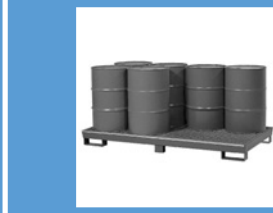
Vol.* 4 bidones (transversales) Pag. 175