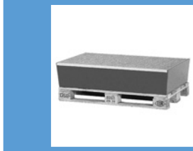
Vol.* 2 bidones Pag. 174