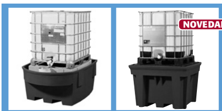
1 IBC Pag. 180, 181