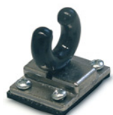
sistema de bloqueo de puertas

Termofusible - uso seguro de los armarios de seguridad según UNE-EN con máxima protección.